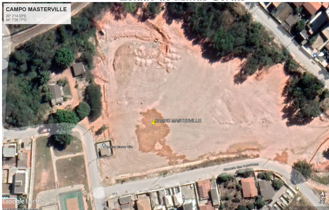
Figura 01 – Localização do campo Masterville

Os munícipes do bairro Masterville sofrem com a falta de um campo no bairro para lazer e atividades físicas, bem como realização de campeonatos e possíveis eventos futuros, dando ao bairro e os munícipes mais qualidade de vida.