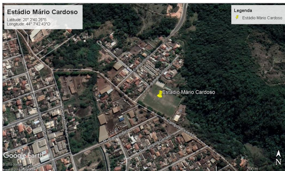
Figura 01 – Localização do estádio municipal Mario Cardoso

O estádio municipal Mario Cardoso localiza-se na Rua Campos Elíseos, s/nº, esquina com Rua Campo Florido, bairro Brasília, região de maior aglomeração populacional do município e, dessa forma, atende diretamente a uma grande parcela dos munícipes.