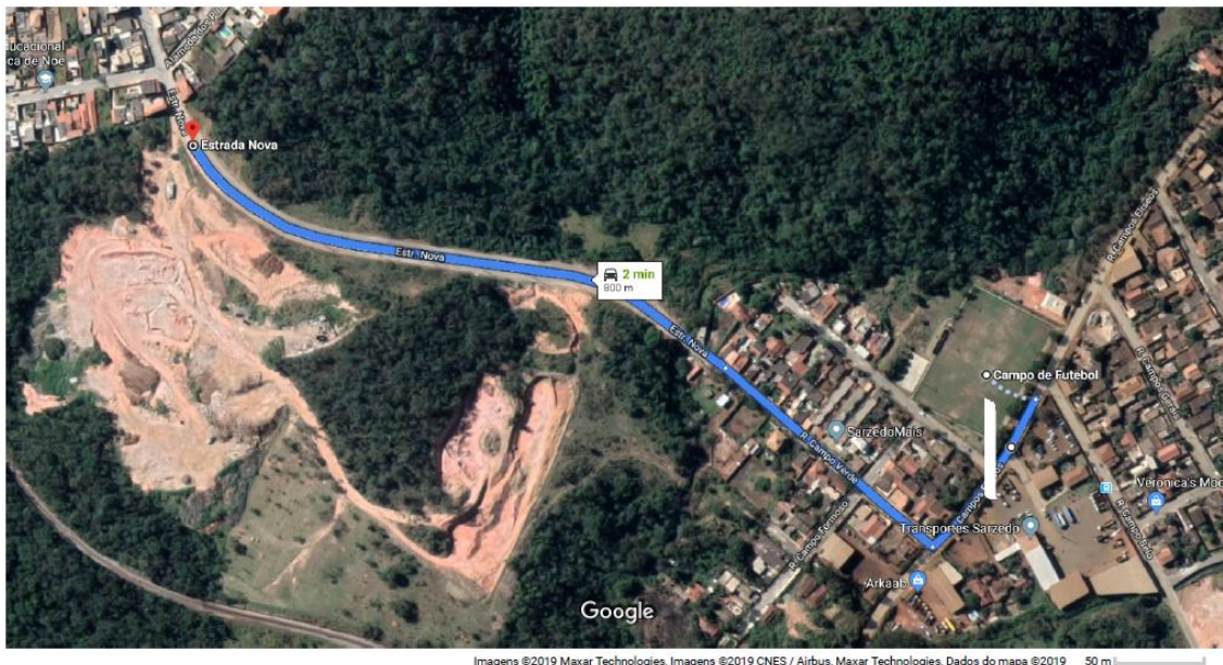
Figura 3 – Distância de transporte entre a jazida de solo argiloso e o local da obra