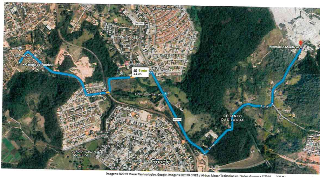
Figura 4 – Distância de transporte entre o fornecedor de BGS e o local da obra

DMT do Fornecedor 1 (Montreal Mineração) de BGS até a obra