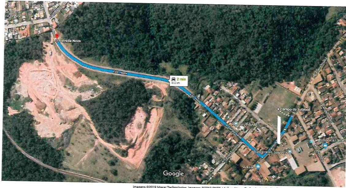
Figura 3 – Distância de transporte entre a jazida de solo argiloso e o local da obra