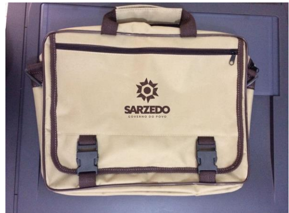
Item 30 – Pasta Individual Servidor