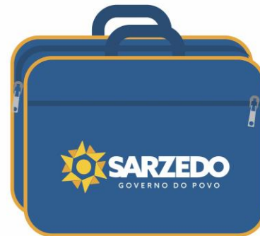
Item 29 – Pasta em nylon liso EJA