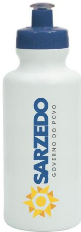
Item 35 – Squeeze