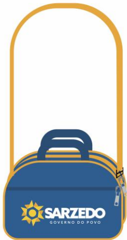
Item 3 – Bolsinha Para Serviçais