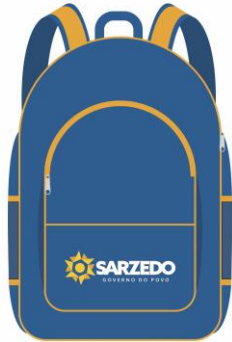
Itens 27 e 28 - Atenção para as medidas