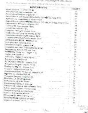
Solicitação feita por Aline para o 1º pedido.jpeg 750 KB