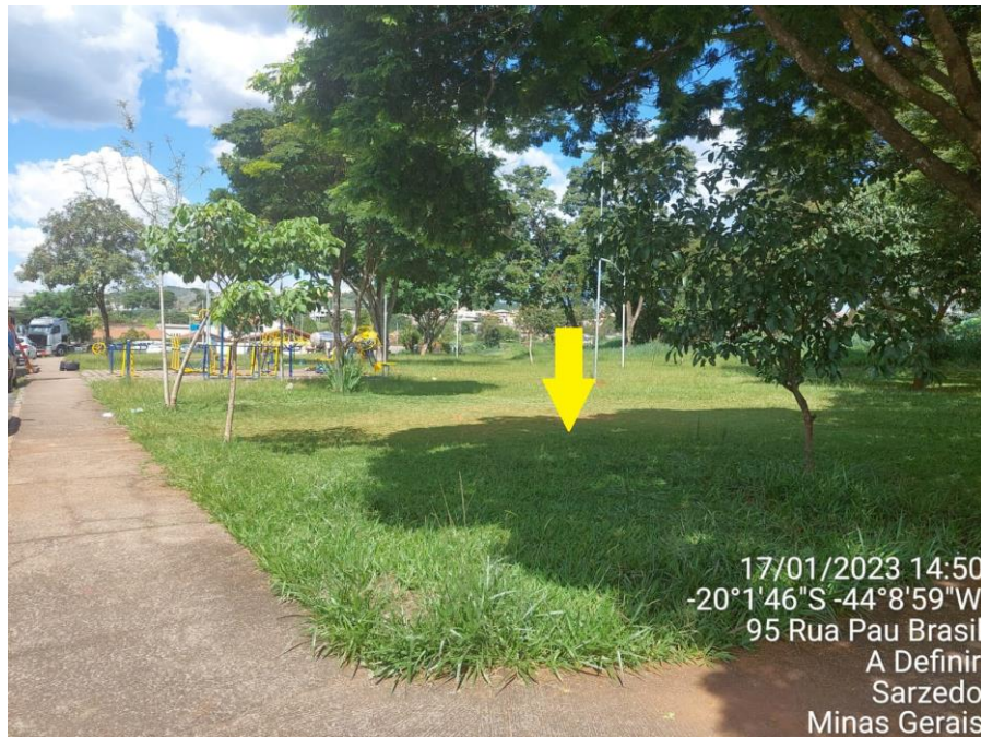
Seta indicando local de instalação na praça do Bairro Riacho da Mata

Fone: (31) 3577-7010 CNPJ: 01.612.509/0001-58