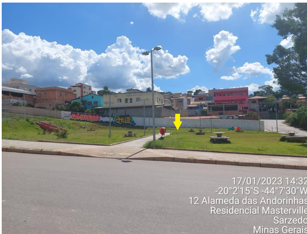
Foto georreferenciada do Bairro Masterville com seta indicando local de instalação do playground

Neste endereço deverá ser instalado 02 (duas) unidades do playground modular de no mínimo 8 atividades, contendo 3 torres; 01 (uma) unidade do balanço teen com 02 assentos e 01 (uma) unidade do escorregador infantil com um balanço para bebê, totalizando 02 (dois) playgrounds e 02 (dois) brinquedos a serem instalados no local. Segue abaixo foto georreferenciada do local: