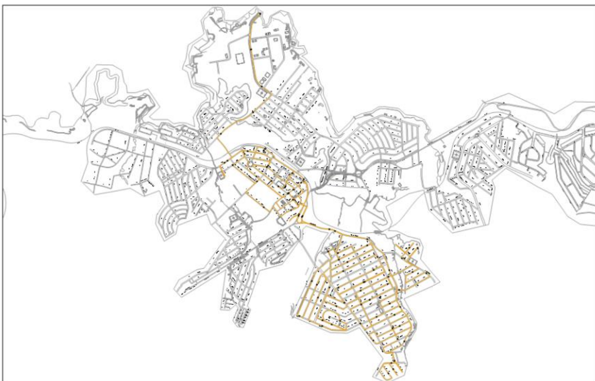
Mapa - Coleta de Resíduos Sólidos. Rota 04