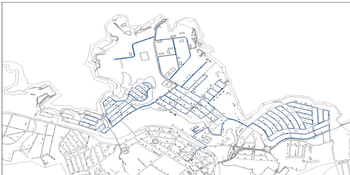
Mapa - Coleta de Resíduos Sólidos. Rota 01