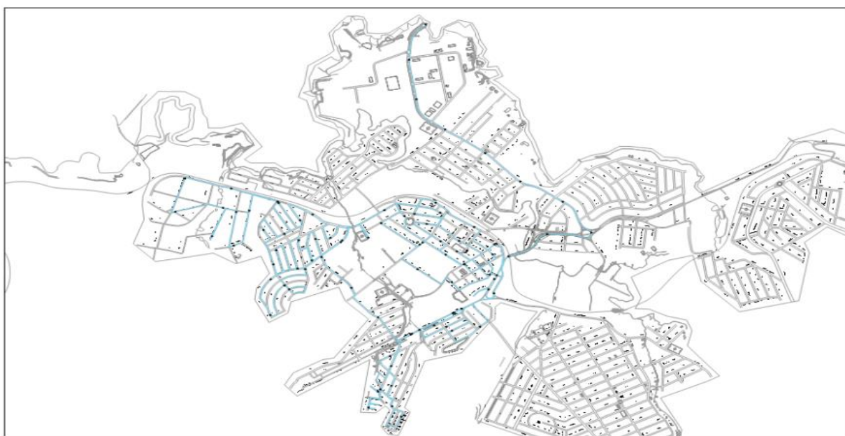
Mapa - Coleta de Resíduos Sólidos. Rota 03